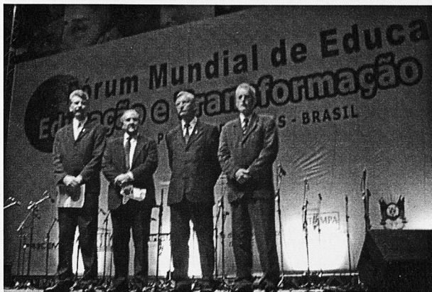
El ministre d'Educació del Brasil, Cristobal Boarque, que va fer el discurs inaugural del Fòrum

tots els nivells d'ensenyament i per a tots els pobles de la Terra, en tots els segments socials. Per això, seran organitzats Fòrums Regionals constituïts per cadascun dels països que varen participar a les dues