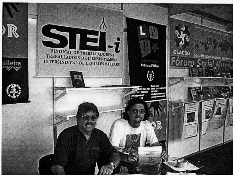
Estand que l'STEL-i va compartir amb CLACSO (Consell Llatinoamericà de Ciències Socials) i LPP (Laboratori de Polítiques Públiques) a Porto Alegre.

Assegurar els drets sindicals i de treball de les treballadores i els treballadors apareix com a condició necessària per a l'elaboració de la Plataforma Mundial d'Educació, que permetrà el desenvolupament de programes i projectes educatius, en