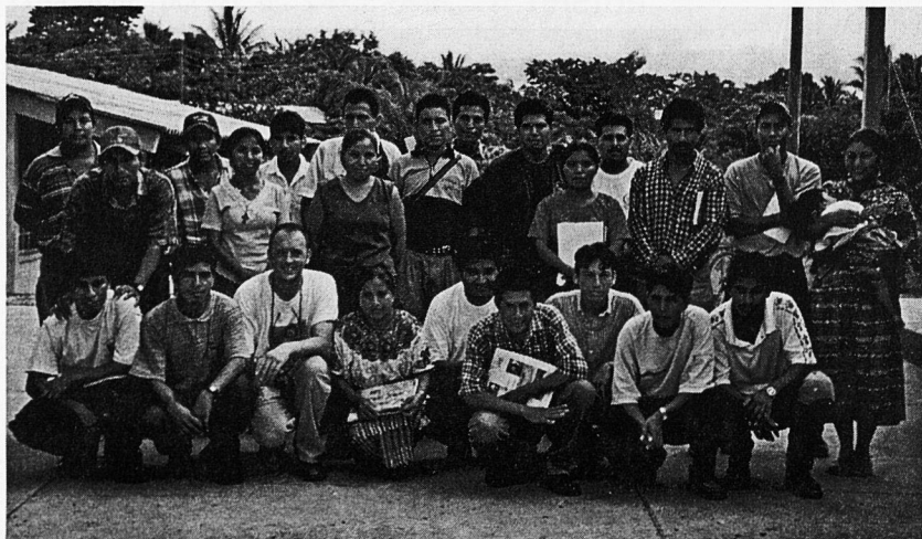
Taller sobre Globalització i Drets Humans

Aquest procés, amb poques diferències és el que s'està vivint a Guatemala, El Salvador i Hondures, països on Ensenyants Solidaris i l'STEI-i