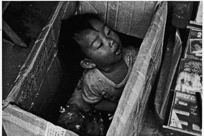
Nin mirant, a quin futur?

Durant els mesos de juliol i agost vint-i-cinc persones han aportat el seu esforç per mantenir un nexa d'unió entre els processos educatius del nostre món desenvolupat amb els d'uns països en els quals la paraula manca omple tots els àmbits. Si a tot això hi sumam el reconeixement que està tenint el nostre model de cooperació, tant a les Illes Balears