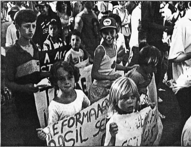
Multituds de totes les edats participaren a les manifestacions del Fòrum Social Mundial

10. Afirmem que els alumnes discapacitats o amb dificultats d'adaptació o d'aprenentatge, els nins i nines del carrer, treballadors o itinerants, els nins i nines víctimes de la guerra han de tenir accés a serveis especials que els permeti la inclusió en el sistema educatiu. Demanem accions concretes per prevenir la sida i garantir assistència integral als afectats.