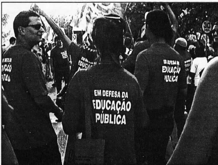
Participants en la manifestació en favor de l'Educació Pública

4. En primer lloc, rebutgem els tractats o projectes que no respectin els interessos i la participació dels pobles, com és el cas de l'ALCA. Reafirmem que l'educació no és una mercaderia; ens oposem enèrgicament a la comercialització en curs de l'educació i que s'inclouin tant l'educació, la cultura, la salut i els serveis públics en general en