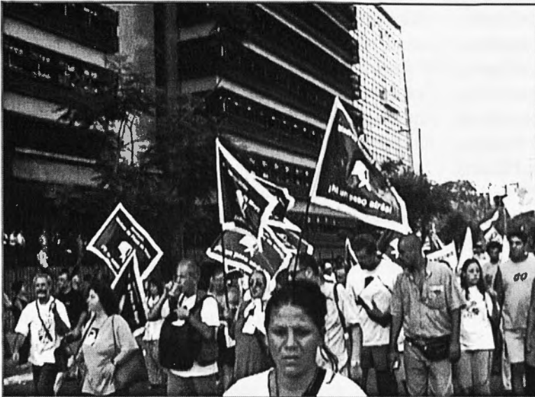
Ni un pas enrera.

Les "madres de mayo" manifestant-se a la inauguració del Fòrum