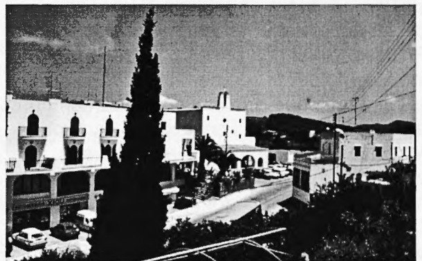
San Josep de sa Talaia. A les darreries del segle XIX, com el pintà l'arxiduc i, un segle després, el 1989, com el fotografià la colla del Canonge. Les diferències i les semblances són bones de veure.

Heu pogut observar com ha seguit canviant fins a arribar a l'actualitat?