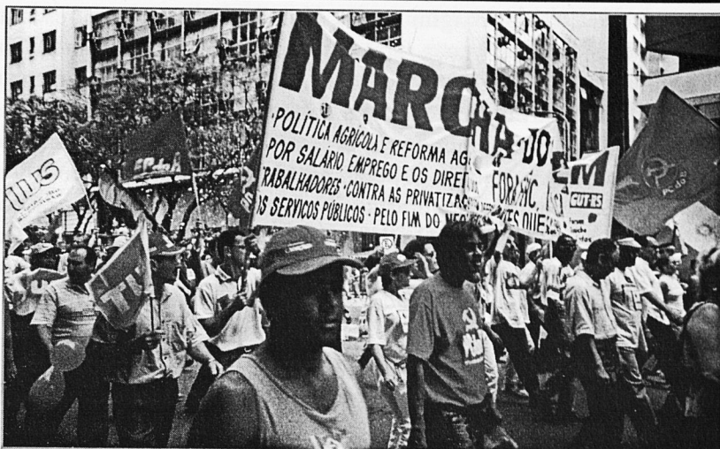
Docents i no docents manifestant-se pels carrers de Porto Alegre

9. També defensem una educació de qualitat per a totes i tots, que sigui un instrument de