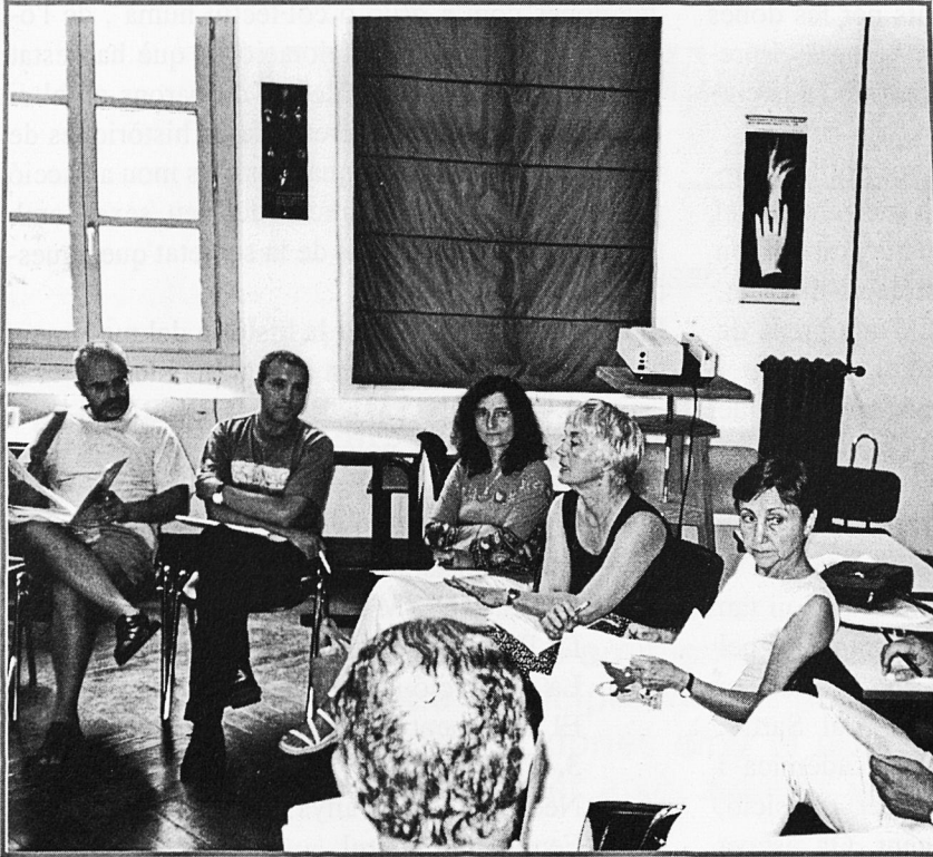
Sessió de treball a l'Escola Sindical de Logroño

tració sofisticada va produir el pensament de la igualtat entre els sexes, encara que, ha sobreviscut millor la reacció patriarcal que va generar: Les facècies bifronts d'Aristòfanes, la Política d'Aristòtil, la recollida de Plató. Amb aquests precedents, es va anar elaborant un discurs de divisió de l'espècie humana en dos: dos cossos, dos tipus de raonament, dues morals, dues lleis, establint, teòricament, la inferioritat de la dona respecte de l'home.