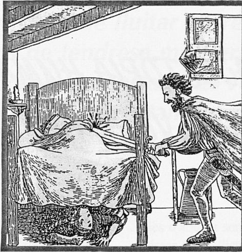
Fulletó de N'Espardenyeta, adaptació teatral de Jaume Vidal Alcover de la rondalla

Només puc acabar lamentant que un govern suposadament d'esquerres i nacionalista no vulgui un ensenyament en català i amb continguts de Països Catalans i continuï amb la política lingüística (amb el