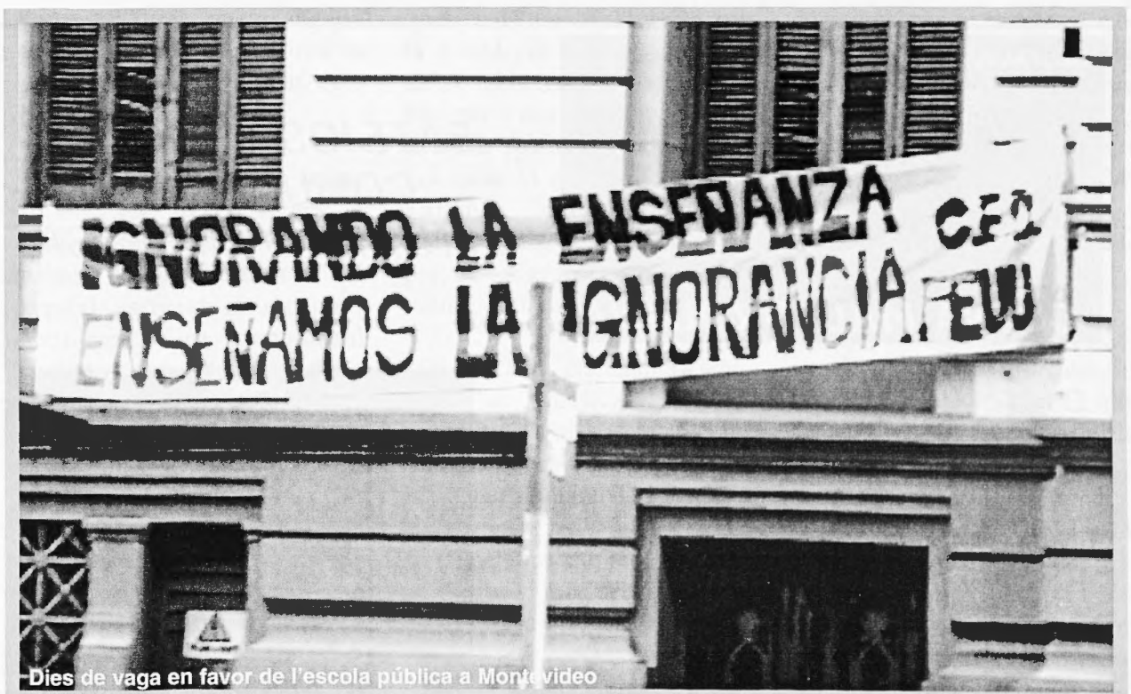
Dies de vaga en favor de l'escola pública a Montevideo

La reforma va retallar els drets laborals dels treballadors de l'educació, precaritzant les condi-