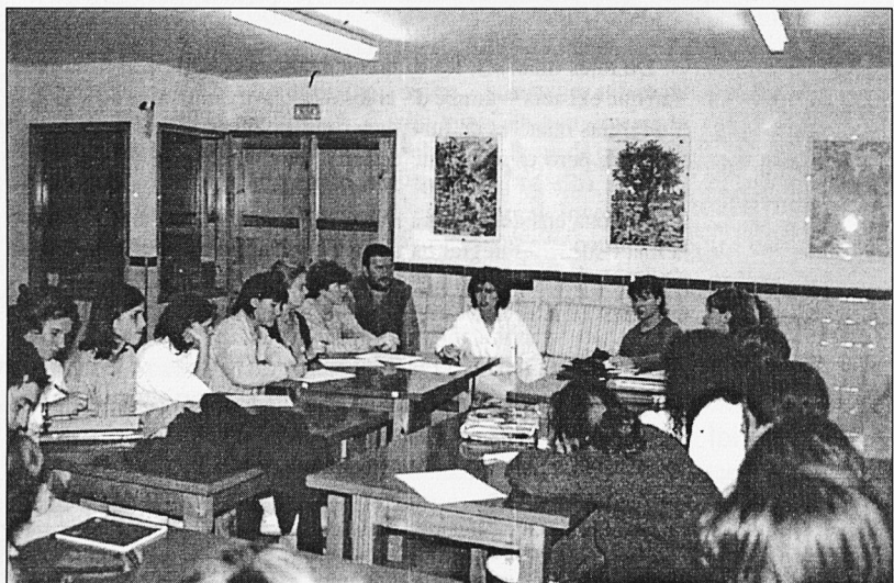
Sessió del Seminari d'escola rural de la Universitat de Vic al Solsonès.

Salvant el temps i els canvis profunds que han esdevingut encara podem afirmar que la imatge de