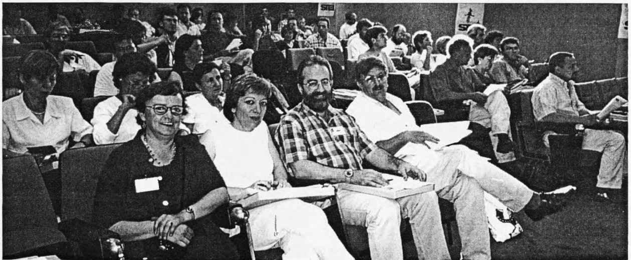
Els congressistes treballant la ponència

Hem de seguir defensant un Conveni Autonòmic. Els nostres problemes els hem de solventar aquí. Per això hem de convèncer les patronals, però també i molt especialment els altres sindicats.