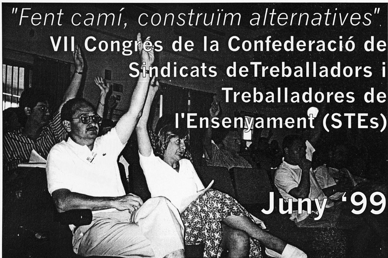
Delegació de l'STEI en un moment de la votació.