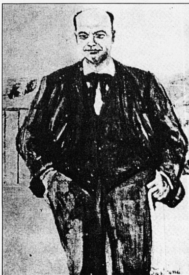
Gabriel Alomar vist pel pintor suec Sjöstrand

La classe obrera illenca es comença a concentrar a certes barriades fabrils, com la Soledat i l'Arraval de Santa Catalina, i s'organitza. Molt lentament, sorgeixen