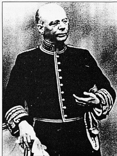
Gabriel Alomar, vestit d'ambaixador.

d'humanista i individualista, influenciada pels corrents filosòfics aristotèlics. Alomar proposà que el catalanisme tengués caràcter propi, fos progressiu i que s'abandonassin els anacronismes, defensà la federació amb els altres pobles ibèrics i denuncià el ruralisme, el tradicionalisme i la burgesia. Al llibre El futurisme (4) afirma que la Història és la lluita de l'home i la natura, que la seva finalitat és modelar la terra, però adverteix que cal transformar-la sense confondre's, perquè les condicions actuals i aparents de