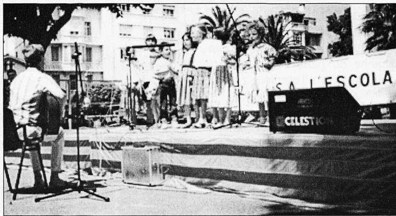
Els nins i nines de la Bressola, cantant.

Farem que comencin primer els nins i nines que ja hi eren el curs anterior per tal de recuperar du-