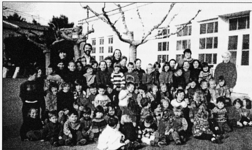
La Bressola de Perpinyà.

Els conflictes entre alumnes i la necessària adquisició dels hàbits de convivència són també un bon mitjà per aconseguir l'expressió en català: demanem que les normes siguin recordades pel nin que ha patit una agressió d'un altre nin: "diga-li no tustem, no pit-