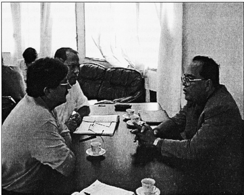
Entrevista amb el Ministre d'Educació d'Hondures.

fa al Ministeri d'Educació, Alemanya ha assumit la reconstrucció dels edificis escolars, en part com a donatiu, i en part com a préstec a baix interès. Actualment ja tenim un 90 % de les aules preparades. Falten les grans escoles que s'hauran d'acabar de tirar a terra per tornar-les construir de bell nou, ja que els desperfectes han estat enormes.