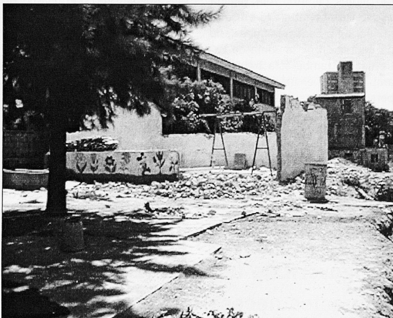
Escola "República de Brasil", afectada per l'huracà Mitch, objecte d'ajuda per part de l' STEI.

Ministre.- Veig que en aquest tema sou molt bel·ligerant. Seria bo continuar-ne i lamentablement no disposam de més temps. Esper que en una pròxima visita ho puguem fer. No us oblideu de transmetre les necessitats que he exposat i, si és possible, organitzar cursos de capacitatció per a docents sobre el tema del currículum de la Reforma.