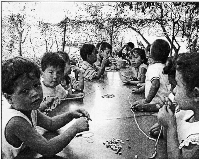
Els nins, malgrat les circumstàncies, segueixen amb la seva tasca.

ta que en educació el poder decisiu més immediat sigui el dels pares de família. Es pretén que siguin ells els que puguin con-