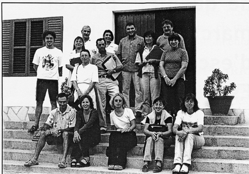
Alguns dels participants a les Jornades d'Es Cubells

- En general, les escoles petites han anat actualitzant-se en quant a mitjans materials,