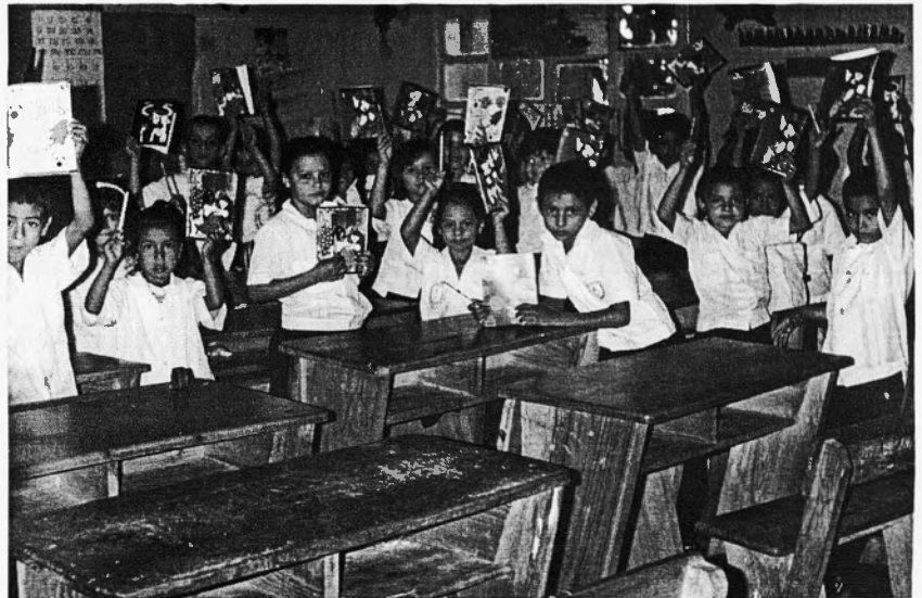
Escolars hondurenys mostrant el material rebut de la campanya de solidaritat d'STEs.

Amb aquest panorama, un arriba a la conclusió que si els que tenen capacitat intel·lectual persisteixen en els seus errors i si els respectius governs no assumeixen el problema ambiental amb veritable preocupació i saviesa, nosaltres, amb l'arma de l'e-