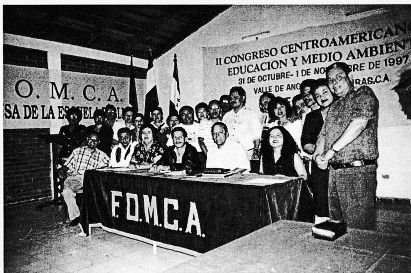
Companys i companyes de Centreamèrica celebrant el Congrés d'Educació i Medi Ambient realitzat amb ajut de la Confederació d'STEs.

És un fet evident que la terra està exposada a l'acció lenta i imperceptible de factors que