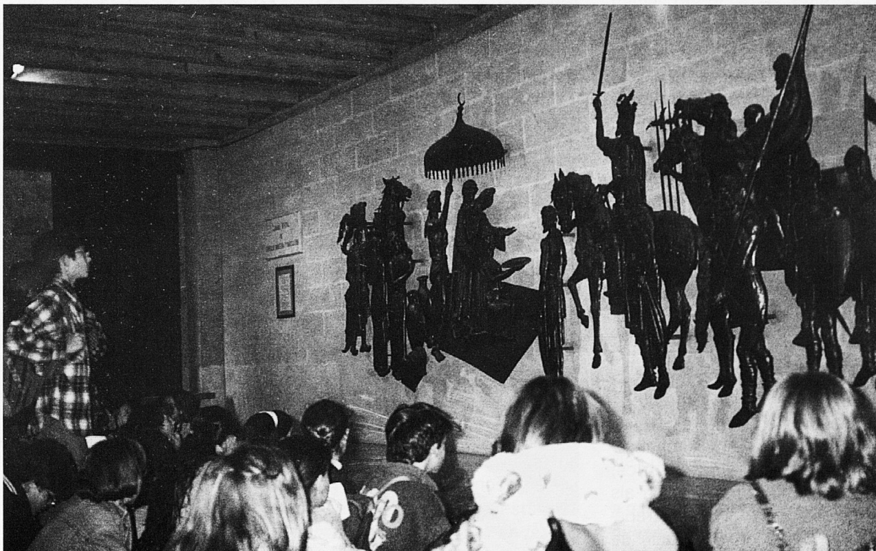
Mural a la Cambra de Comerç.

A les nostres Illes, els profunds canvis que ha sofert durant els darrers anys i encara pateix el paisatge poden donar molt de si per treballar a l'escola (societat pre-turística, desenvolupisme, ...). També són moltes les restes i les construc-