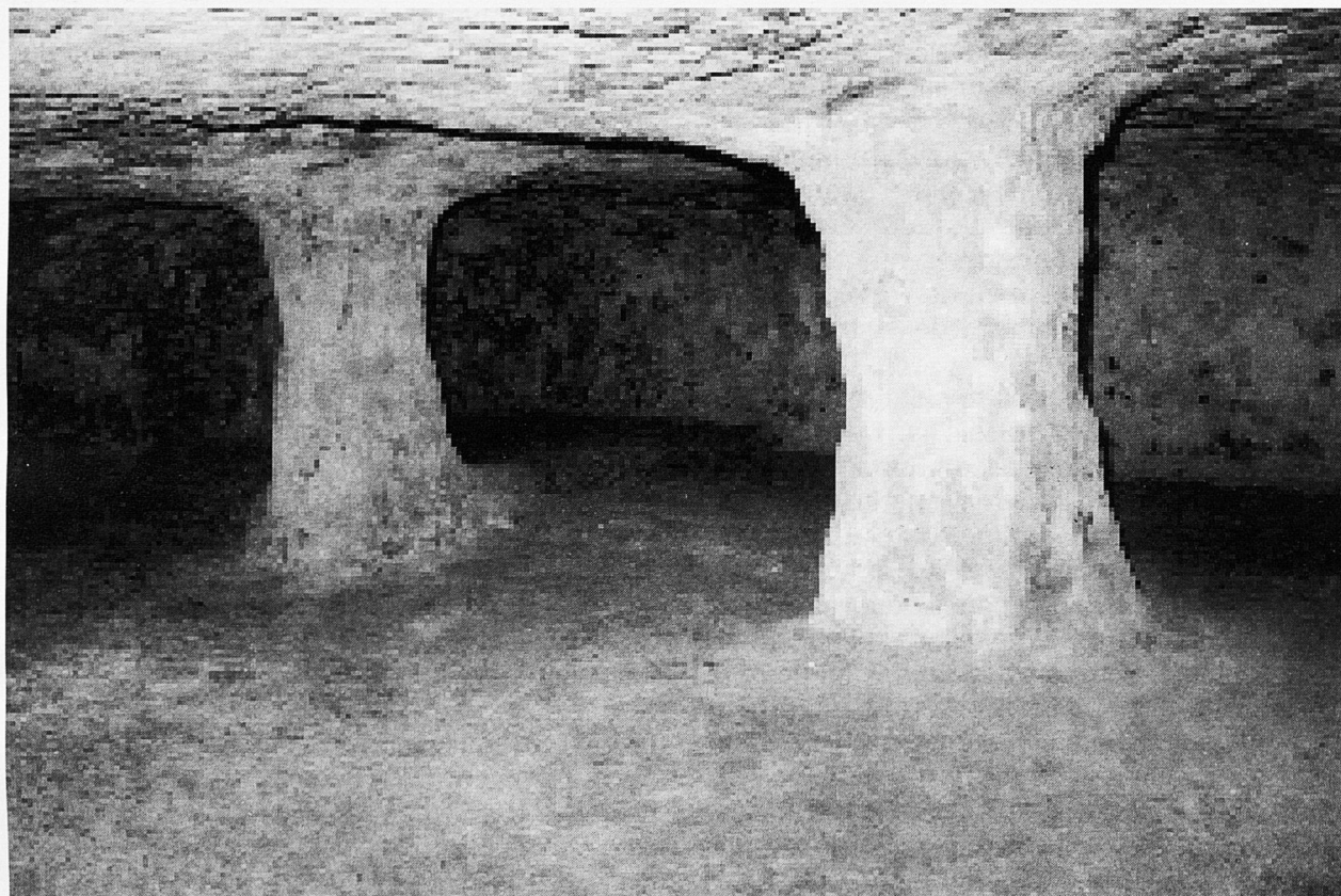
Interior de la cova de cala Morell

d'introduir entre la població uns mínims elements de tolerància, ja no parlem de simpatia, cap a les diferents realitats nacionals. Per saber per on