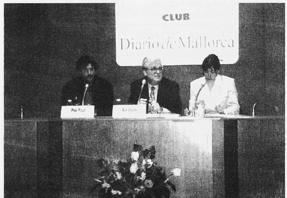
Moment de la conferència

Finalment, Jouen convidà totes les organitzacions educatives a estudiar l'Informe i presentar-ne les propostes que es considerin oportunes. □