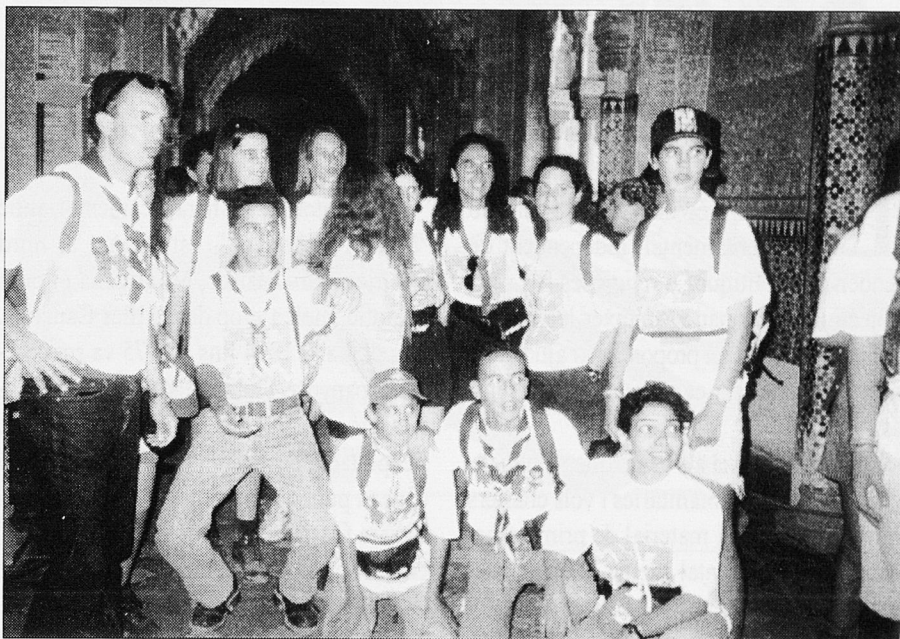
Campament de les Tres Cultures. Visita cultural.

L'Educació pel Desenvolupament constitueix un camp al qual hi ha moltes coses per fer. Fonamentalment la difusió del coneixement de les altres cultures i punts de vista des del prisma de la tolerància, la ins-