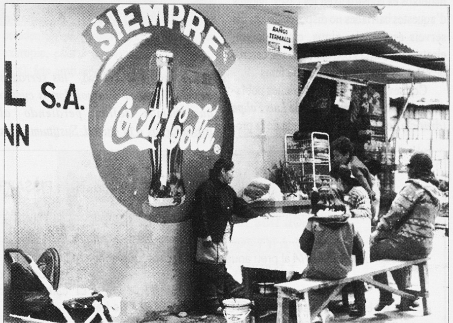
La grandesa de les multinacionals

Només un canvi en les relacions econòmiques internacionals podria canviar les vides dels pobladors de l'hemisferi Sud. Vist d'aquesta manera pot semblar que no hi ha res a fer i que tot depèn dels grans poders polítics i sobretot econòmics. Però