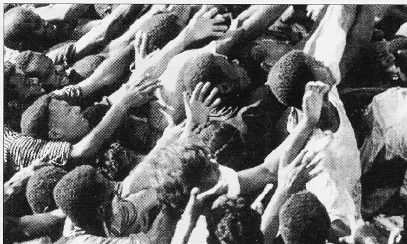
"Volen viure avui..."

Aquestes demandes són les premisses per al retorn a l'Estat de Dret i per a l'inici de negociacions immediates sense exclusió de cap de les parts en conflicte, sempre i quan depositin les armes. Hem denunciat també el doble llenguatge de certs països i certes institucions de la comunitat internacional que, mentre condemnaven el cop, animaven el dictador o demanen que els demòcrates burundesos i els països de veïnat l'acceptin com un mal menor o l'hi donin