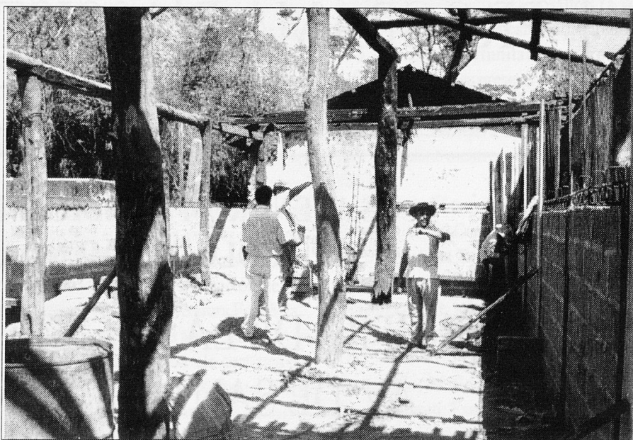
L'escola de Corinto-La Fuente en fase de construcció

Els executors del projecte es trobaren amb dificultats per accedir al lloc de la construcció a causa del mal estat del terreny, un