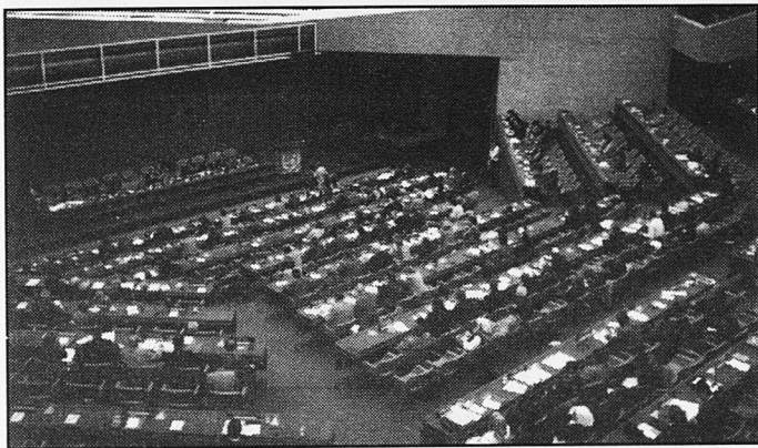
Sessió plenària de la 45a Conferència Internacional de l'Educació. Ginebra, setembre 1996.

L'enfortiment de la funció del personal docent davant el desafiament plantejats pels canvis d'aquest fi de segle, ha estat el tema principal dels treballs de la 45 a Conferència Internacional de l'Educació (CIE) que s'ha celebrat a Ginebra del 30 de setembre al 5 d'octubre, en la que han participat representants dels governs dels Estats membres de la UNESCO, encapçalats pels ministres d'educació o alts funcionaris, juntament amb altres