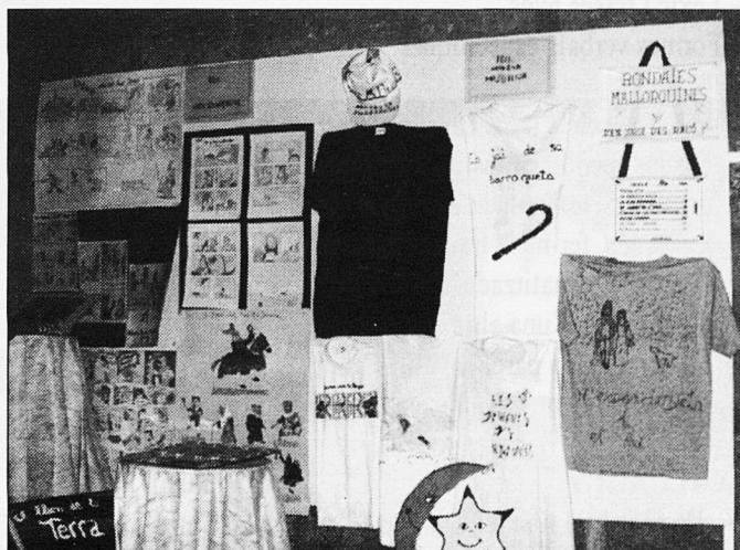
Exposició de material elaborat pels alumnes de l'IES Madina Mayurqa. Maig 1996

Es produeix a la que hem llegit? Justifica la teva resposta.