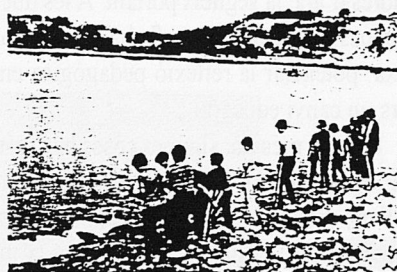
EIVISSA, DEL 10 AL 15 DE SETEMBRE

L'any 1984 un grup nombrós de mestres, conscients de la necessitat d'ajuntar el gran col·lectiu que érem i de dur a terme la important tasca de renovació pedagògica a les nostres illes, decidírem agrupar les nostres forces i crear l'Associació Pitiüsa per a la Renovació Pedagògica (APREP). Una de les primeres tasques que es plantejà fou l'organització de la II Escola d'Estiu, patrocina-