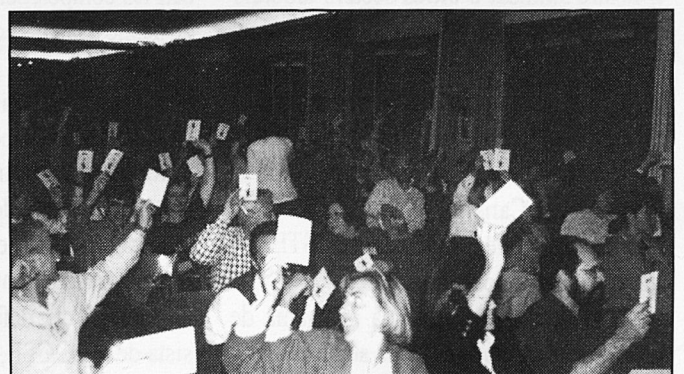
Delegats i delegades en una de les votacions.