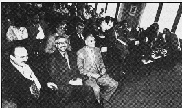
Convidats a l'acte d'obertura del Congr s.