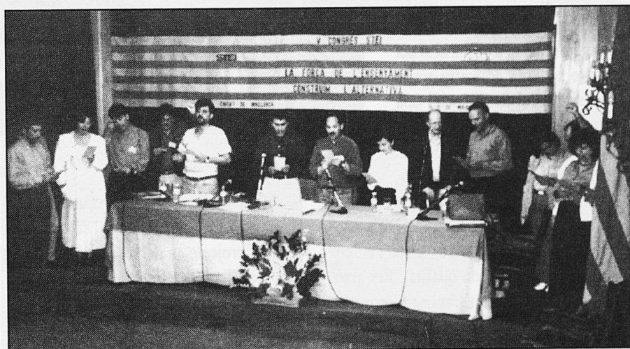
Amb el cant de la Balanguera va concloure el Congrés.

I ara, de debó, ens caldran més que mai. □