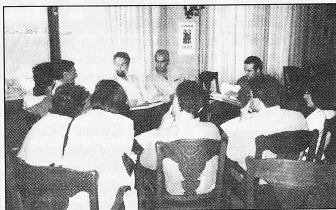
Reunió de treball

de l'activitat sindical d'ençà del darrer congrés.