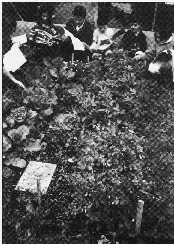
Els alumnes fan el seguiment del creixement de les plantes

6. Glossari: s'elabora al llarg del curs amb el vocabulari que va sorgint i també amb refranys, glosses i dites sobre les plantes.