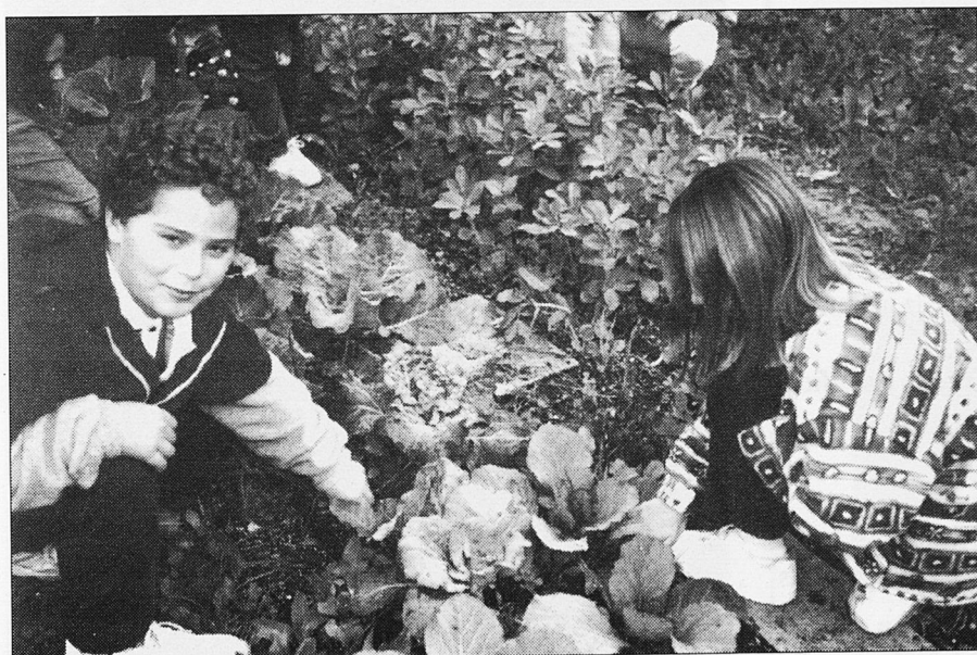
I per mostra unes faves, unes cols ...

Els mestres que ho heu experimentat sou els qui teniu la paraula. □