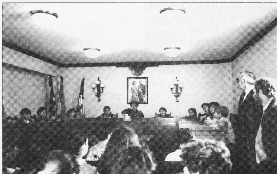
Presència d'escolars a les dependències de l'Ajuntament de Sant Llorenç

A nivell general, el material es compon d'una sèrie de dossiers informatius o guies per al professorat, alguns estan complemen-