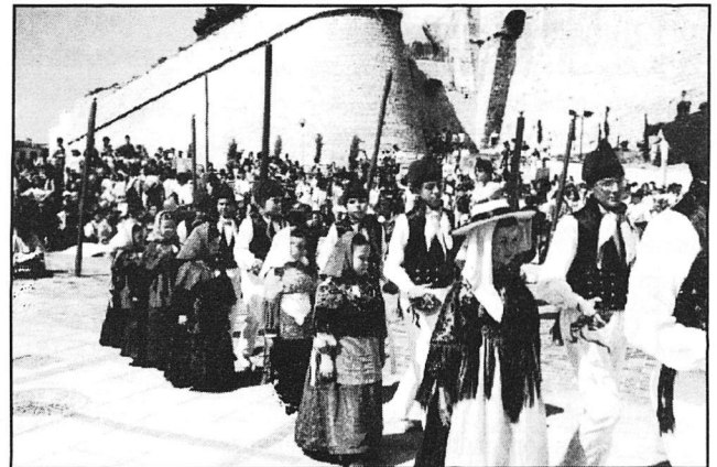
Grup folklòric eivissenc