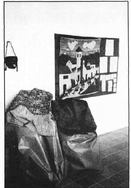
Mostra de productes de Llatinoamèrica