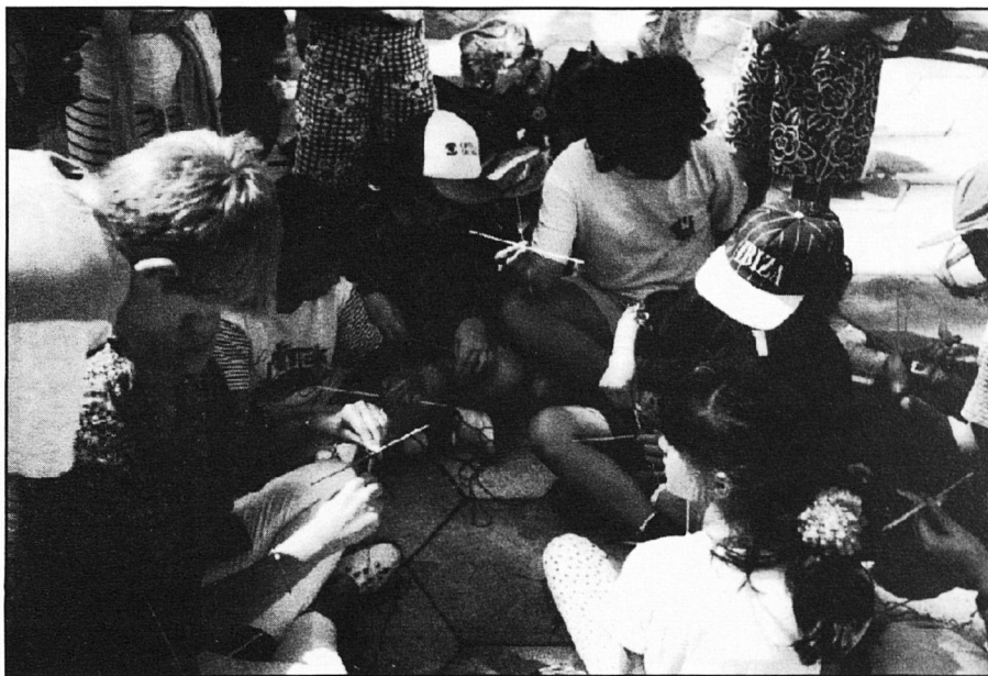
Taller de fil, a Figueretes

Un enorme cuc solidari presidia, des de la murada eivissenca l'acte amb el qual havia de concloure la diada.