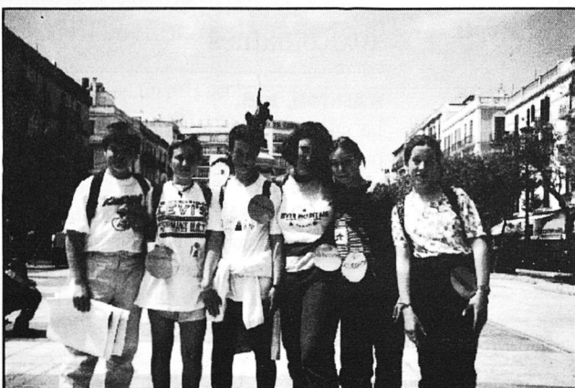
Ambient de solidaritat pels carrers de Vila