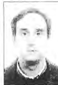
Pau Morlà Florit CP Mare de Déu del Toro Es Mercadal