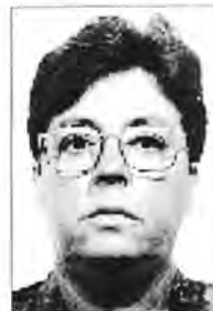
Pilar Pons Goñalons CP Mare de Déu de Gràcia Maó