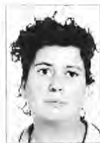
Trinitat Joan Jaume CP Sant Francesc Xavier Formentera

42. Reducció, racionalització i flexibilització de les ràtios d'integració, amb dotació de mitjans adequats i eliminació de barreres arquitectòniques.