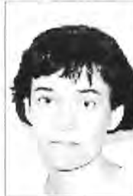
Assumpció Torres Benejam CP Pintor Torrent