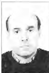
Lluís Marín i Vicens CP Eugeni López i López Palma