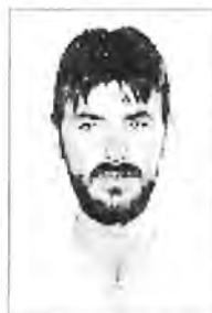
Llorenç Caules Coll IES Pasqual Calvó i Caldés Ciutadella

67. Funcionament flexible dels centres que permeti l'assumpció, per part de les dones, de les tasques de gestió i coordinació, així com la seva participació en la formació permanent.