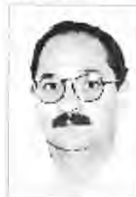
Onofre Martí Mir CP Mare de Déu del Toro Ciutadella

postes alternatives concretes (plan-tejades en tots els àmbits de negociació i participació i recollides en la pràctica dels sectors d'educació progressistes), que és possible una política educativa que serveixi per avançar cap en el model d'una escola pública de qualitat