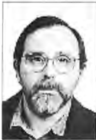
Joan Mora i Mir CP Ca's Saboners Magaluf

59. Creació i potenciació dels Consells Escolars Municipals, Territorials i Provincials.