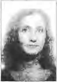
Aurora Vidal Parrón CP Joan Miró Palma