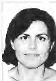
Catalina Pons Seguí CP Mare de Déu del Toro Es Mercadal