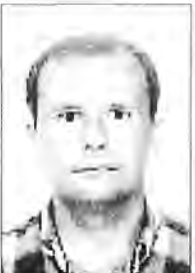
Mateu Tomàs Humbert CP Fra Juníper Serra Petra

77. Les places d'assessors pedagògics tendran caràcter temporal i