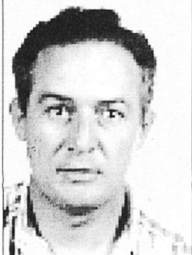
Lluís Cladera Massanet CP Jaume Fornaris i Taltavull Son Servera