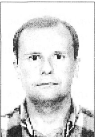
Mateu Tomàs Humbert CP Fra Juníper Serra Petra

77. Les places d'assessors pedagògics tendran caràcter temporal i