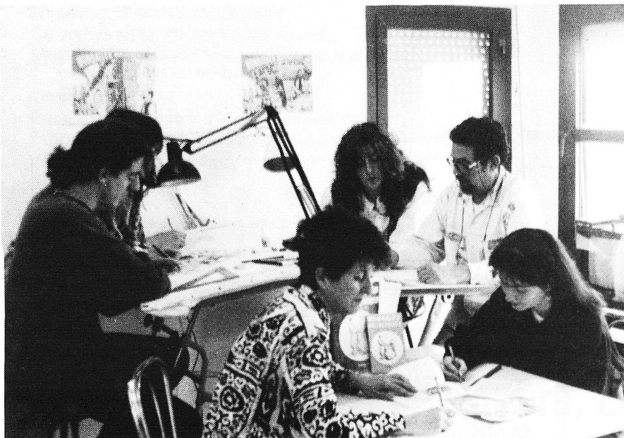
Els autors treballant en l'adaptació de les Rondalles