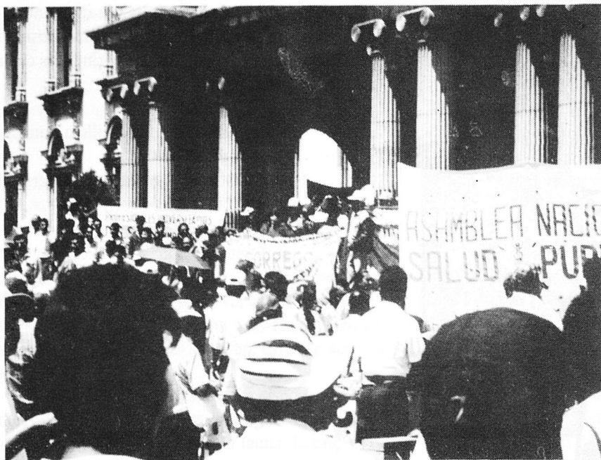
Guatemala, després de 15 dies de vaga, manifestació de funcionaris públics davant el Palacio Nacional

Em pregunten que difongui els seus problemes i el comunicat conjunt que envien a Ginebra, on està reunida la comissió de Drets Humans de la ONU. En aquest document, totes les ONGs de Guatemala indiquen: "Para la mayoría de nosotros, que vivimos la represión en carne propia, lo expresado en el documento es el reflejo de una situación en nuestro país, en donde todos los derechos civiles, políticos, sociales y culturales, así