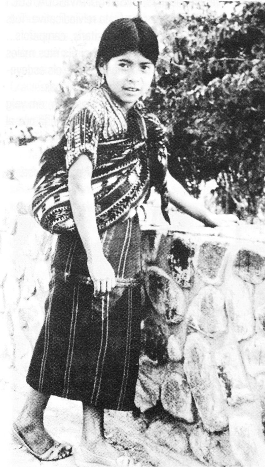
Guatemala. Llac Atitlan. NINA de 10 anys, venedora ambulante, portant a l'esquena una criatura de dos mesos

L'informe permet veure que en el 93 continuaren els morts per motius polítics i que exceptuant alguns casos, el govern no va agilitzar les investigacions per lograr la detenció i judici dels responsables.