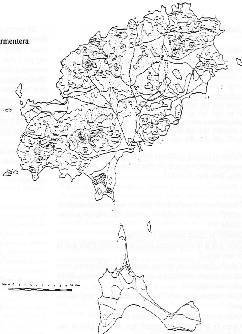
VILÀ (Coord.), VALLÉS-PRATS-RAMON: Geografia de les illes Pitiüses . Unitat primera: Presentació de les illes d'Eivissa i Formentera. La Geografia Física i la Biogeografia, Eivissa, 1979-80, pàg. 13

Observa detingudament el mapa d'Eivissa i Formentera: