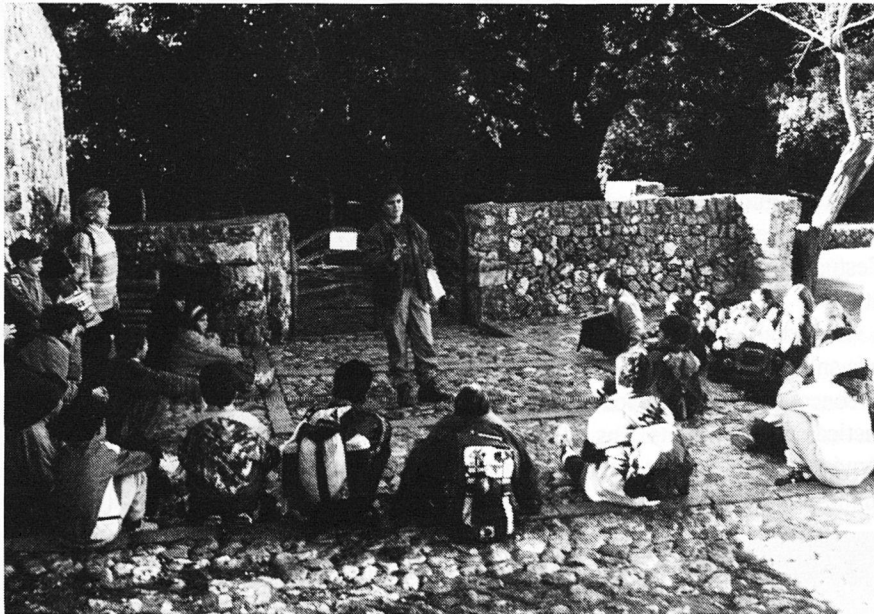
El Camp d'Aprenentatge de Binifaldó permet fer estades de un, dos o cinc dies i treballar a partir d'itineraris i observació directa l'entorn proper a les possessions de Menut i Binifaldó. A la fotografia es veu el moment en que comencen les activitats de l'estada.

Al principi els Camps eren «una eina a l'abast de les escoles per motivar els seus alumnes» que es perllongava a l'escola per espai de 15 dies o un mes després de la visita. La influència dels moviments per la conservació de la natura i de l'educació ambiental han fet, però, que els Camps evolucionin cap a una didàctica ambiental a partir de la geografia i les ciències naturals.