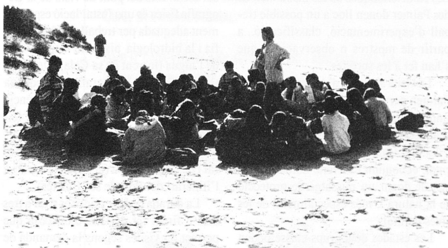
El Camp d'Aprenentatge es Palmer permet l'estudi directe de la platja des Trenc i del Salobrar de Campos amb un treball mediambiental i de protecció dels ecosistemes.

Els itineraris pedagògics que es poden fer són: es Trenc, es Salobrar, son Lladó, Campos i sa Colònia de Sant Jordi. Actualment s'utilitza per les escoles que ho demanen l'itinerari «De s'Es-