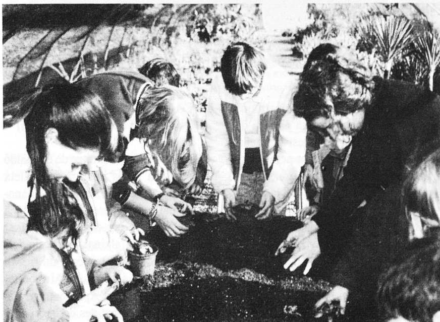
El Camp d'Aprenentatge Agrícola de Son Ferriol té com a activitat de manipulació directa de l'alumnat la sembra d'una planta que després es porta a l'escola per estudiar i cuidar el seu creixement.