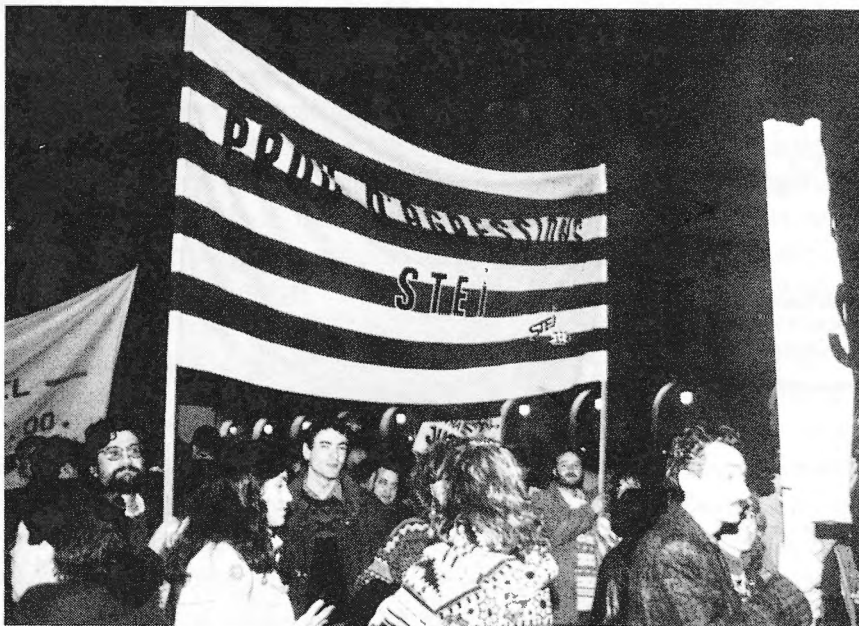
L'STEI a la manifestació de la vaga general.

Aquesta reclamació es fa més urgent quan comprovem que el govern autonòmic-socialista-del País Valencià va acceptar uns serveis mínims (a on en cas de vaga del cap d'estudis i/o del secretari, el director era l'únic obligat a romandre al