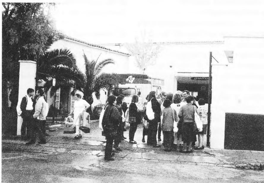
Excursió de l'E.A. Son Canals

(*) Assessora Tècnica Docent del Programa d'Educació d'Adults