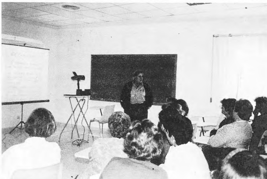
Adults. La Vileta

utilització del conjunt dels recursos educatius i culturals a una més estricta coherència, essencialment en funció de la competitivitat industrial. Si fóra així, ens hauríem de preparar per afrontar el risc d'assistir de nou a una reafirmació d'orientacions dirigides al contingut del dret a l'estudi amb els tot just aconseguits estàndards per fer front a les necessitats de la producció.