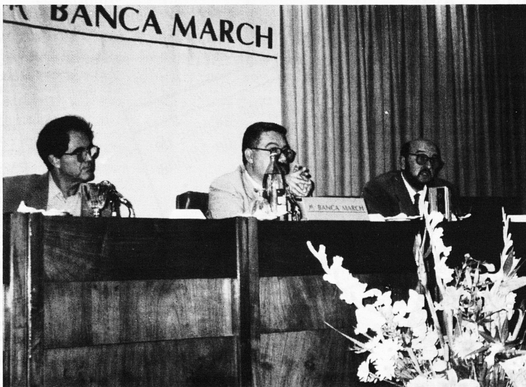
Acte de presentació del llibre La Cinta de Plata , de Miquel Sbert i Garau, a la sala d'actes de la Banca March.

(*) Informació facilitada per la Conselleria de Cultura, Educació i Esports.