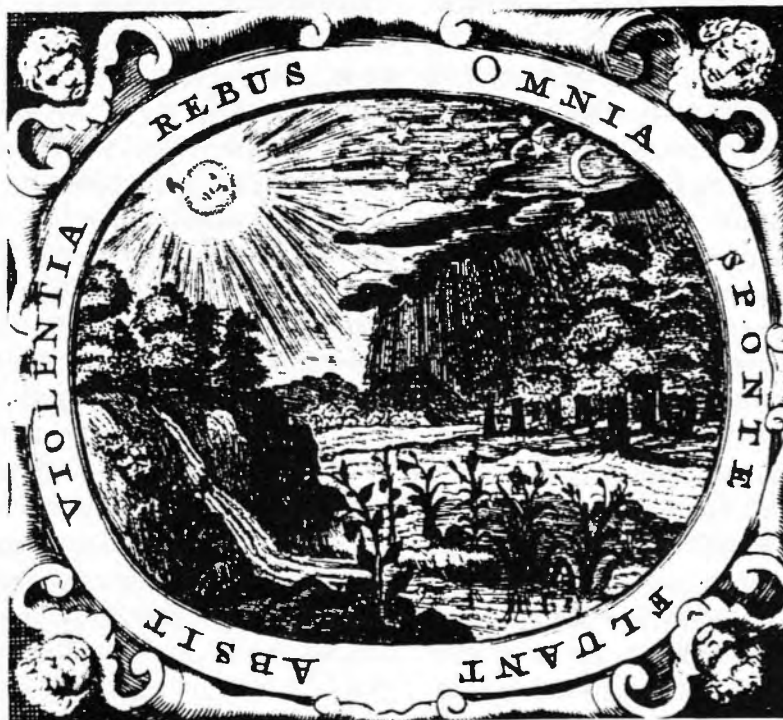
"Let everything ensue by itself, let violence be remote from things", principi fonamental de Komensky per a l'educació dels joves.

l'esforç per la reforma de l'ensenyança i de les escoles forma part dels esforços per la reforma social, convertint-se d'aquesta manera en una arma política. Els resultats de la seva estada anglesa varen ser molt valuosos -fou allà on tingué la idea de redactar el Consell general per al millorament de les coses humanes , d'allà data l'inici de la seva Via de la llum amb la proposta de l'organització internacional del treball científic; allà es va inspirar per la seva obra més extensa El mètode d'idiomes novíssim . No es tracta d'un simple resum de definicions de com ensenyar el llatí (els principis pedagògics universals els va resumir Comenius en el capítol La didàctica analítica ), sinó també d'una aplicació de tals principis a l'ensenyança de la llengua materna, de reflexions sobre el caràcter dels idiomes en general, i també de les condicions per a crear una llengua universal. Dignes d'atenció resulten també les reflexions sobre les llengües natives d'Amèrica basades en l'obra de José de Acosta i de La Casas. Resulta interessant que probablement de la mateixa època prové el manuscrit de la biblioteca universitària de Praga sobre la Lengua general de los indios . La comparació entre la riquesa ideològica de Comenius i l'evolució del pensament en la seva pàtria, de la qual s'allunyava cada vegada més, amb els escrits de Valeriano Magna, però principalment de Caramuel de Lobkowitz (un mig espanyol) i de l'espanyol Rodrigo de Arria-