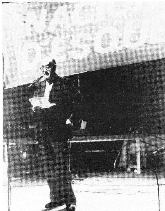
Un acte electoral dels Nacionalistes d'Esquerra.