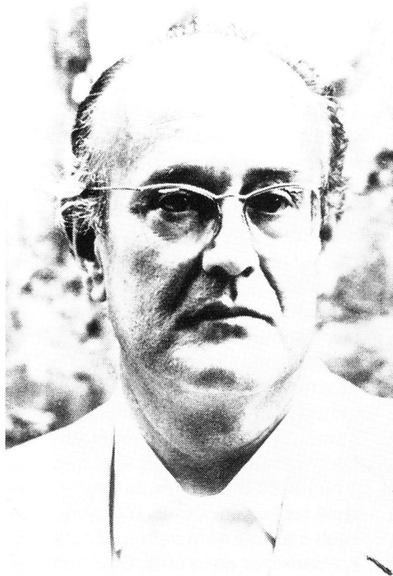
Llompart als inicis dels anys setanta...

Arribaràs un bell migdia, tots els camins t'hi portaran (si és que en el cor el sol et nia i ombres deixata pel mar gran).