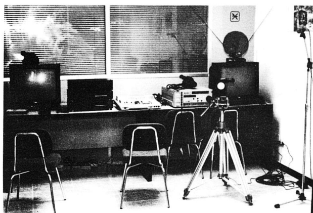
Sala de video