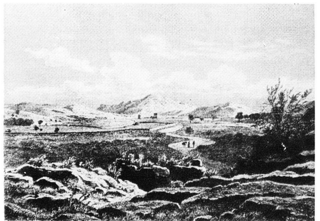
Santa Ponça en temps de l'Arxiduc