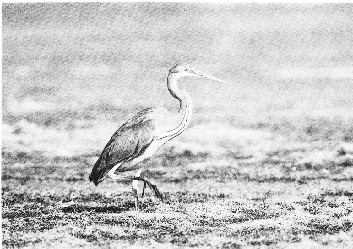
A la fotografia de Climent Picornell veim un Agro Roig de la colònia de nidificació ubicada a S'Albufera.

La segona sessió teòrica va tenir com a eix, la descripció de les diferents tècniques d'observació, d'estudi i de gaudiment de l'ornitologia de camp. Així es va passar revista a les formes adequades perquè l'observador s'integri en el medi i a les eines bàsiques per realitzar i obtenir profit d'una