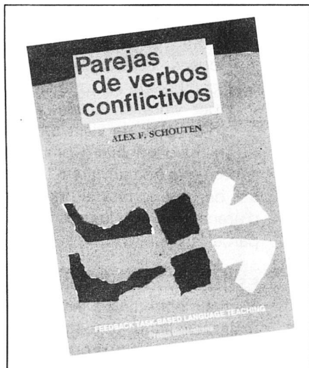
Autor: Alex F. Schouten

"Feedback task-based Language Teaching" es una serie dirigida a alumnos de idiomas de BUP, COU, Escuelas de Idiomas, Escuelas de Turismo, Escuelas de Magisterio y, en definitiva, a cualquier persona que dominando los tiempos básicos del inglés y desea adquirir una mayor precisión en el uso de la lengua.