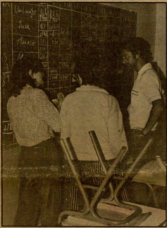
SETEMBRE CALENT: TANT DE PNNS, AGREGATS I ATURATS